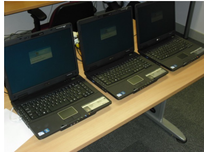
Dyma esiampl o'r gliniaduron os ydych yn penderfynu i'w defnyddio!

Mae Canolfan Hyddgen (sydd wedi'i leoli ar hen safle ffreutur yr ysgol) wedi profi ei hunan i fod yn rhan bwysig o addysg yn Ysgol Bro Ddyfi. Yn ogystal â'i rôl yn y gymuned, gall yr adeilad gael ei ddefnyddio gan y disgyblion. Yn ogystal ag ystafelloedd ar gyfer defnydd y cyhoedd, ac ar gyfer hyfforddiant, mae yna ystafell yn benodol ar gyfer defnydd myfyrwyr Ysgol Bro Ddyfi, lle maent yn gallu gwneud gwaith cyfrifiadurol neu hyd yn oed waith ysgrifenedig.